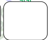
खातावाल ब्यक्तिको औठ छाप

नोट: कुनै एक महिनाको बचत नगरेमा आफूले जम्मा गरेको रकम मात्र पाईनेछ यस खाताको अन्य कुनैपनि सर्त लागू हुने छैन ।